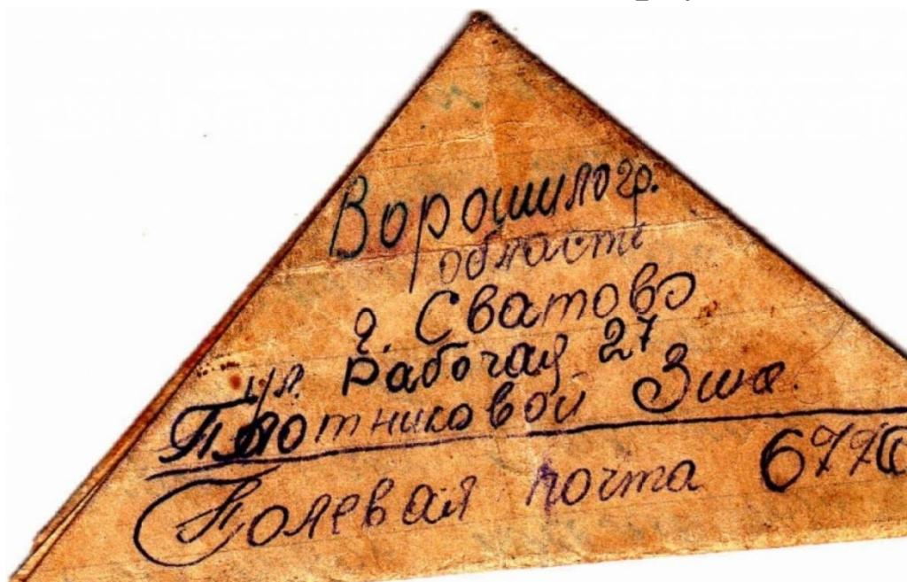
Фото взято из открытых электронных источников и выложено на сайте для не коммерческого использования!